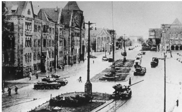
W 1956 roku w Poznaniu doszło do robotniczych protestów, które przerodziły się w trwające trzy dni walki uliczne. Na zdjęciu czołgi T34/85 przed dawnym Pałacem Cesarskim na pl. Mickiewicza w Poznaniu.

Tymczasem w Poznaniu około godziny 10 wśród demonstrantów rozeszła się wiadomość – fałszywa – o aresztowaniu w Warszawie ich delegacji. Ta iskra doprowadziła do niekontrolowanego wybuchu. Doszło do ataku na więzienie, które zdobyto i uwolniono 257 więźniów. Zaatakowano też prokuraturę. Niszczono akta i przejmowano zapasy broni palnej. Duża grupa ruszyła na siedzibę Wojewódzkiego Urzędu do Spraw Bezpieczeństwa Publicznego. Około godz. 10.40 jego załoga otworzyła ogień do zgromadzonego na ulicy tłumu. Po południu skierowane do Poznania wojsko rozpoczęło siłowe tłumienie zamieszek. Do akcji weszły oddziały 19 i 10 Dywizji Pancernych oraz 4 i 5 Dywizji Piechoty. Warto w tym miejscu dodać, że w późniejszych relacjach uczestników wydarzeń wielokrotnie powtarzał się motyw atakowania demonstrantów przez żołnierzy noszących polskie mundury, ale mówiących wyłącznie po rosyjsku. Ta sprawa nigdy nie została rzetelnie wyjaśniona.