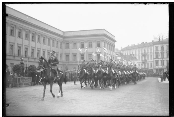
Kawaleria w II Rzeczypospolitej (do 1924 nazywana Jazdą) podczas uroczystości na pl. marsz. Józefa Piłsudskiego w Warszawie 11.11.1929 r.

W II Rzeczypospolitej tworzenie artylerii konnej rozpoczęto w 1919 roku poprzez sformowanie pierwszych 6 dywizjonów, a w następnym roku kolejnych 2. Wzięły one udział w wojnie z bolszewikami. W bitwie z Konną Armią Budionnego pod Komorowem odznaczyły się 1 i 2 baterie 1 i 6 Dywizjonów Artylerii Konnej.