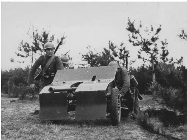
Armata przeciwpancerna 37 mm wz. 36 Bofors z oddziału kawalerii z rozłożonymi blachami, na stanowisku ogniowym podczas ćwiczeń.

Małymi towarzyszkami „prawosławnych” z artylerii konnej były 37 mm armaty przeciwpancerne Boforsa 10 , których pociski przebijały pancerze każdego niemieckiego czołgu. Mit ugruntowany po wojnie przez znakomity skądinąd film Andrzeja Wajdy „Lotna” wyrządził wielką szkodę polskiej kawalerii. Na szczęście dzisiaj do publicznej świadomości przebija się już ten prosty fakt, że w 1939 roku polska kawaleria miała do walki z bronią pancerną nowoczesny arsenał,