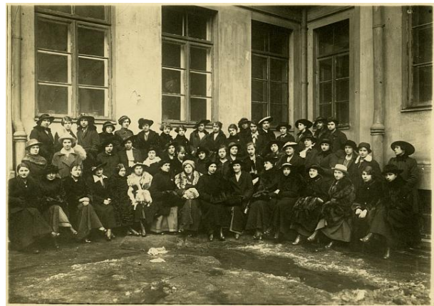
Zdjęcie ochotniczek Polskiej Organizacji Wojskowej.

W pierwszym okresie wojny POW prowadziła działalność wywiadowczą – dywersyjną oraz szkoleniową na terenach opanowanych przez Rosjan. Na terenach zajętych przez Niemców i Austriaków zgodnie z przyjętą zasadą tymczasowości walki z Rosją, organizacja pozostawała w konspiracji. Dzięki intensywnej pracy szeregi POW szybko rosły. Jej działalność z czasem ze strefy przyfrontowej przeniosła się na Ziemię Zabrane (Kijów) i daleko w głąb Rosji – do Odessy, na Kubań, do Moskwy, Piotrogradu, a nawet do Murmańska. Peowiaci prowadzili wywiad, a także dywersyjnie atakowali rosyjską infrastrukturę wysadzając mosty lub składy.