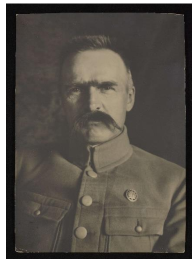
Fotografia – portret Józefa Piłsudskiego (1914-1918).

Pojęcie „polskiej Armii Podziemnej” z reguły automatycznie kojarzymy z II Wojną Światową i takimi formacjami jak Armia Krajowa. W naszej pamięci historycznej zupełnie pomijana jest wcześniejsza o prawie trzy dekady Polska Organizacja Wojskowa 1 . To też było konspiracyjne wojsko, o kadrach liczonych w dziesiątkach tysięcy, obejmujące swoim działaniem ogromne obszary Europy Środkowej i Wschodniej. Formalnie POW powstała w październiku 1914 roku w Warszawie. Wywodziła się jednak z grup i organizacji działających wtedy już od przeszło dekady. Jej głównym kadrowym źródłem była Organizacja Bojowa Polskiej Partii Socjalistycznej 2 , utworzona w kwietniu 1904 roku z inicjatywy Józefa Piłsudskiego.