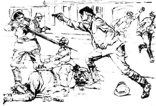
Bojowiec OB PPS strzela do policjanta. Rysunek H. Niewiadomska z pisma „Robotnika” (1908).

Po formalnej likwidacji organizacji w grudniu 1918 roku przeszło 26 tysięcy jej żołnierzy zostało wcielonych do różnych pułków Wojska Polskiego. W latach 1918 – 1921 byli peowiacy wzięli udział w praktycznie wszystkich polskich powstaniach. Szczególnie odznaczyli się na Śląsku, chociaż trzeba zaznaczyć, że Polska Organizacja