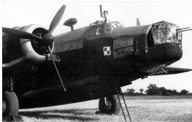
Bombowiec Wellington 304 Dywizjonu z czasu służby w Bomber Command.

Debiutem bojowym dywizjonu była noc z 24 na 25 kwietnia, kiedy to dwie załogi wzięły udział w nalocie na zbiorniki paliwa w porcie Rotterdam. W kolejnych miesiącach polscy lotnicy wielokrotnie brali udział w atakach na niemieckie miasta oraz niemieckie zgrupowania we francuskich portach. Bombardowano między innymi: Bremę, Emden, Hamburg, Kolonię, Rostock i Szczecin.