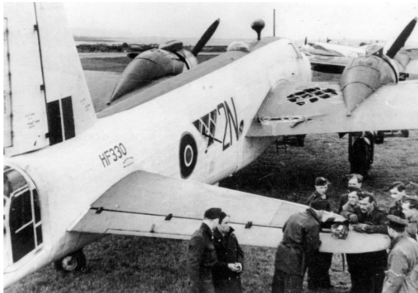
Wellington GR Mk XIV (wersja używana przez Obronę Wybrzeża) 304 Dywizjonu uszkodzony po walce, podczas której zatopił niemiecki okręt podwodny (U-321?).

Wobec problemów z uzupełnieniami 10 maja oficjalnie przeniesiono 304 Dywizjon do Dowództwa Obrony Wybrzeża 6 . Z bazy Tiree dywizjon latając na specjalnie przystosowanych Wellingtonach prowadził służbę patrolową nad północnym Atlantykiem. Po miesiącu przeniósł się do Dale, skąd operował nad Zatoką Biskajską. Były to długie, wyczerpujące fizycznie i psychicznie loty. Głównym zadaniem było tropienie i niszczenie niemieckich okrętów podwodnych. Walki z u-bootami trafiały się rzadko. Do końca wojny