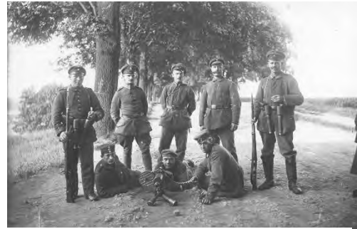
I Powstanie Śląskie. Oddział Grenschutzu: fotografia grupowa. Uzbrojenie żołnierzy: granaty trzonkowe Stielhandgranate 17 i lekki karabin maszynowy MG 08/15 (1919 r.).

POWGS przystąpiła do niego nieprzygotowana, bez dostatecznej ilości broni i planów operacyjnych. Dodatkowo niemieckie aresztowania zdekompletowały jej dowództwo.