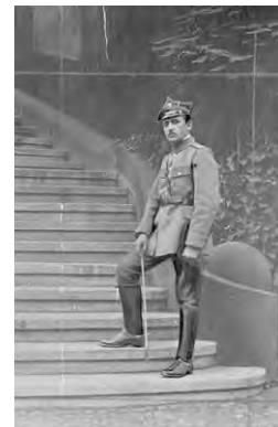
Alfons Zgrzebniok.

Chaos organizacyjny próbował opanować Alfons Zgrzebniok 8 tworząc jednolity sztab. Mimo początkowych sukcesów powstańców, ostatecznie wygrała niemiecka przewaga liczebna i sprzętowa. Już 24 sierpnia Alfons Zgrzebniok wydał rozkaz zaprzestania walki. Ratując się przed niemieckimi represjami ponad 9 tysięcy powstańców przeszło za kordon, na teren państwa polskiego. Pomimo klęski zbrojnego wystąpienia i późniejszych represji Niemcy przegrali listopadowe wybory komunalne, obsadzając mniej niż 40% miejsc w poszczególnych radach. Zaskakująco dobry wynik dał Ślązakom nadzieję na zwycięstwo w plebiscycie mającym odbyć się pod międzynarodowym nadzorem. Nie odpuścili i zaczęli szykować następne powstanie – tym razem znacznie lepiej zorganizowane, uzbrojone i wyposażone.