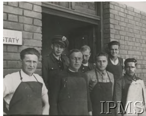
1940, Targoviste, Rumunia. Obóz dla internowanych żołnierzy Wojska Polskiego.