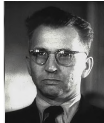
Leopold Okulicki „Niedźwiadek” – ostatni komendant AK.

Armia Krajowa została rozwiązana 19 stycznia 1945 roku rozkazem jej ostatniego komendanta – generała Leopolda Okulickiego ps. „Niedźwiadek” 8 .