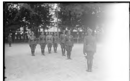
Wizyta dowódcy Brygady Pancerno-Motorowej płk. dypl. Stefana Roweckiego w koszarach 1 Pułku Strzelców Konnych (3 sierpnia 1939 r.).

Armia Krajowa była największą polską formacją konspiracyjną w czasie II Wojny Światowej. Została powołana rozkazem Naczelnego Wodza generała broni Władysława Sikorskiego z dnia 14 lutego 1942 roku po przemianowaniu Związku Walki Zbrojnej. Było to „podziemne” Wojsko Polskie, część Sił Zbrojnych Rzeczypospolitej, oficjalnie podlegała konstytucyjnym władzom państwa działającym na obczyźnie 34 . Komendant AK podlegał wprost Naczelnemu Wodzowi PSZ. Ostatnim komendantem ZWZ i pierwszym dowódcą Armii Krajowej był generał Stefan Rowecki ps. „Grot” 5 . Dzięki staraniom komendanta AK wchłonęła w całości lub częściowo większość działających w okupowanej Polsce organizacji zbrojnego podziemia, w tym min: Narodową Organizację Wojskową, Komendę Obrońców Polski, Narodowe Siły Zbrojne i Bataliony Chłopskie.